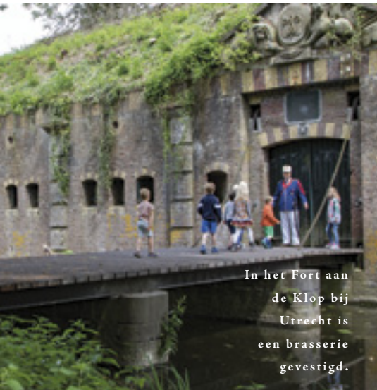
In het Fort aan de Klop bij Utrecht is een brasserie gevestigd.

De doorgezaagde bunker 599 aan de Diefdijk bij Culemborg is nu een attractie voor bezoekers. Deze werd in 1940 gebouwd als groepsschuilplaats. ▼